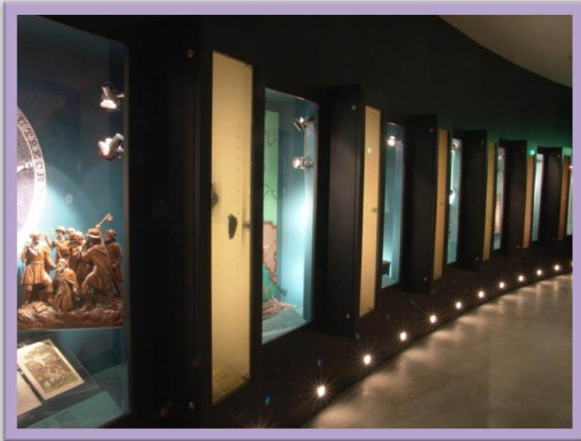
Begin van de Bonifatius expositie zoals deze in het Bonifatiusjaar 2004 werd gerealiseerd in het pand naast het Admiraliteitshuis.